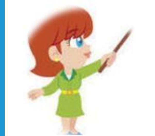
Teknoloji ve Tasarım Öğretmeni