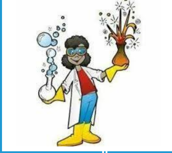
Fen Bilimleri Öğretmeni