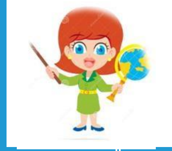
Sosyal Bilimler Öğretmeni