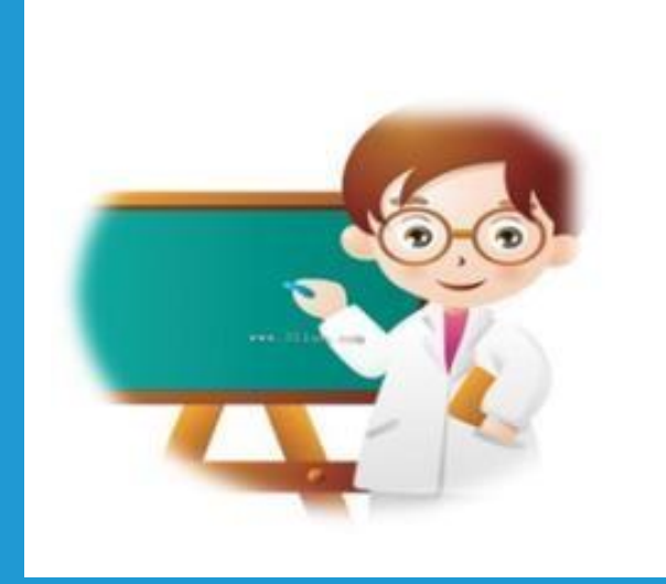
Din Kültürü ve Ahlak Bilgisi Öğretmeni