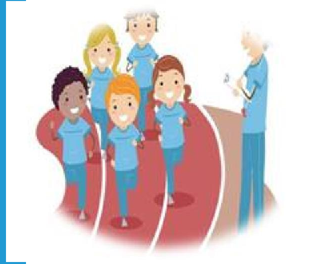
Beden Eğitimi ve Spor Öğretmeni