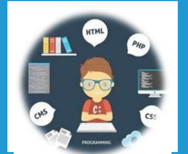
Bilişim Teknolojileri ve Yazılım Öğretmeni